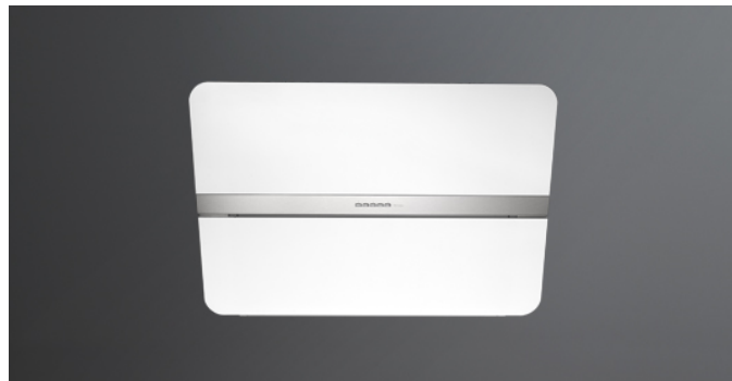
Fotografie cu caracter strict orientativ Aceasta poate sa nu corespunda versiunii selectate