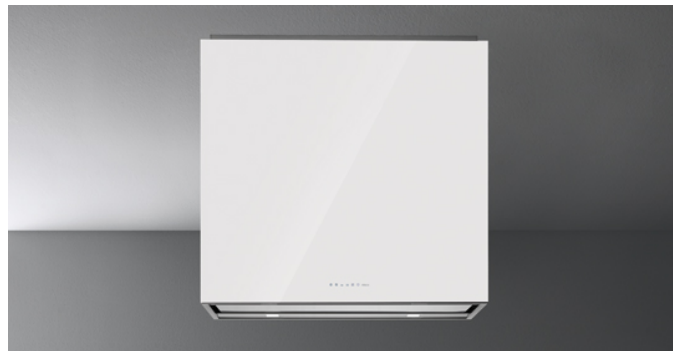
Fotografie cu caracter strict orientativ Aceasta poate sa nu corespunda versiunii selectate