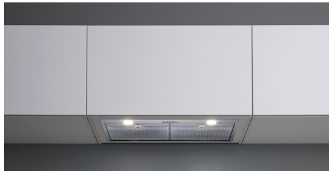
Fotografie cu caracter strict orientativ Aceasta poate sa nu corespunda versiunii selectate