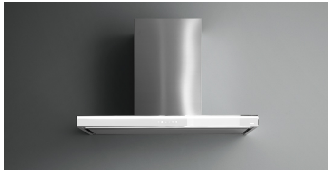
Fotografie cu caracter strict orientativ Aceasta poate sa nu corespunda versiunii selectate