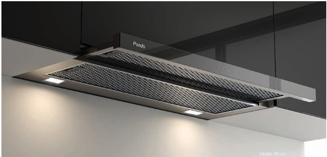
Model. 60 cm